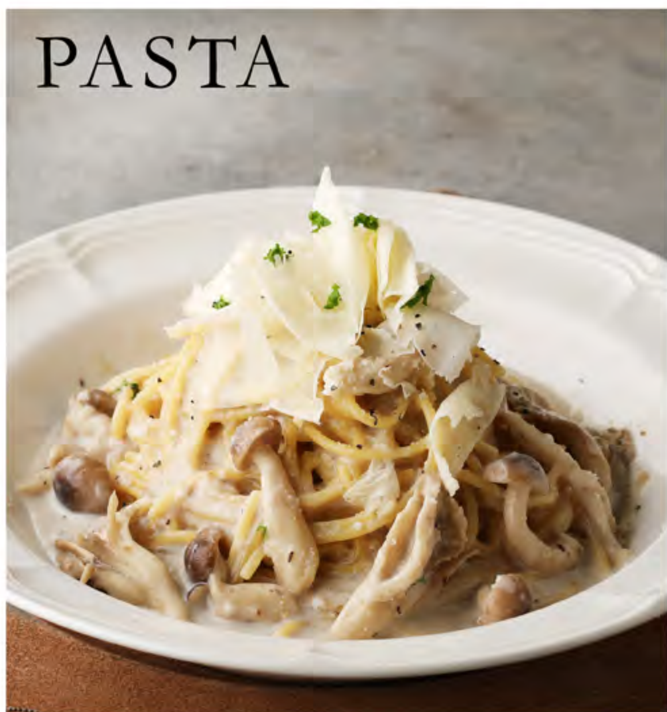
きのこのチーズクリームパスタ