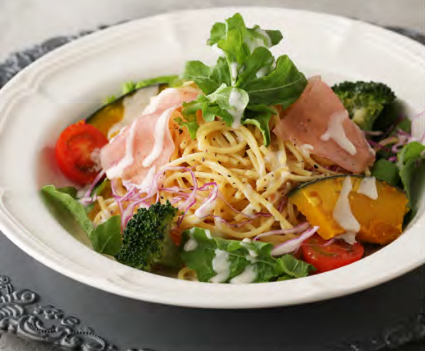
生ハムと彩り野菜のペペロンチーノ