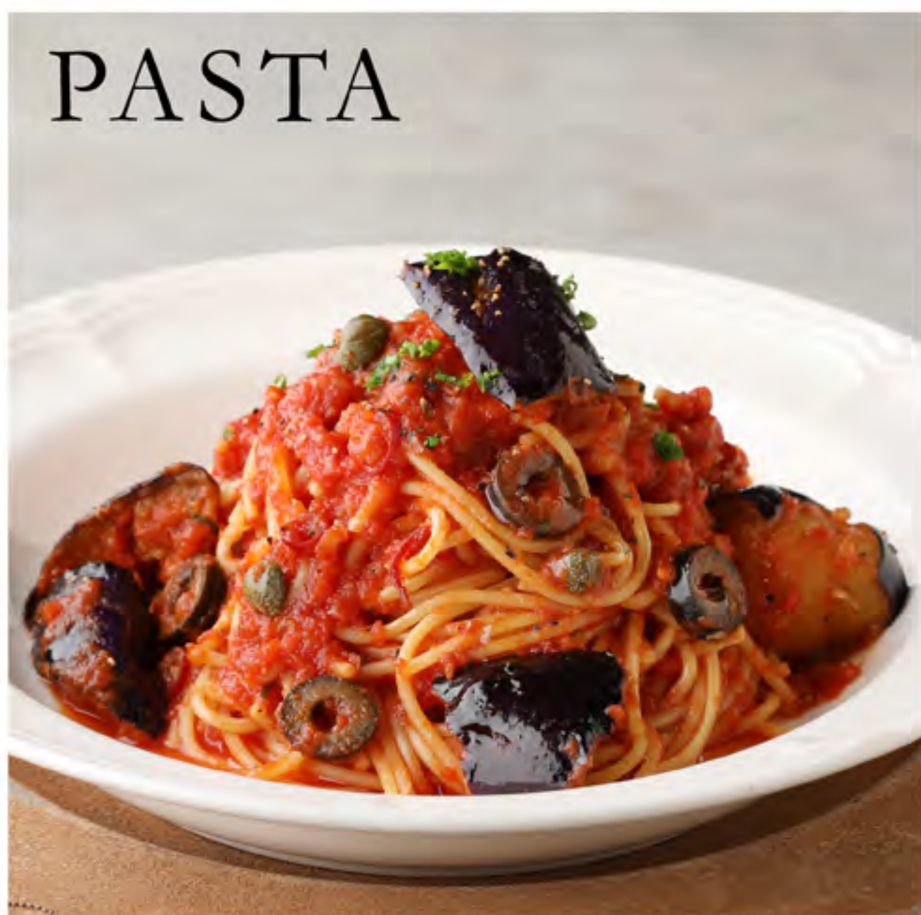
揚げ茄子のプッタネスカ風 トマトソースパスタ