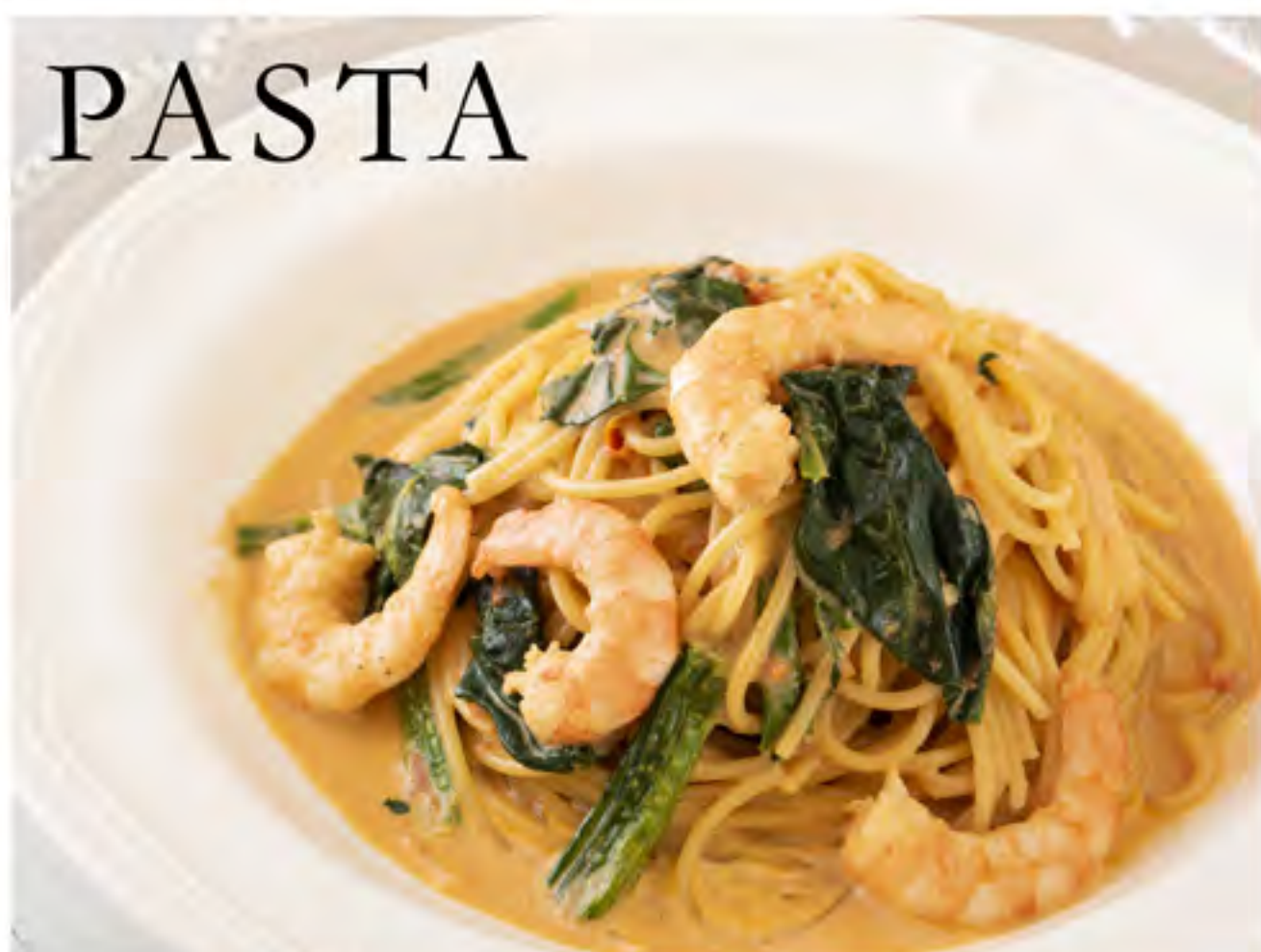
海老とほうれん草の アメリカーナクリームパスタ