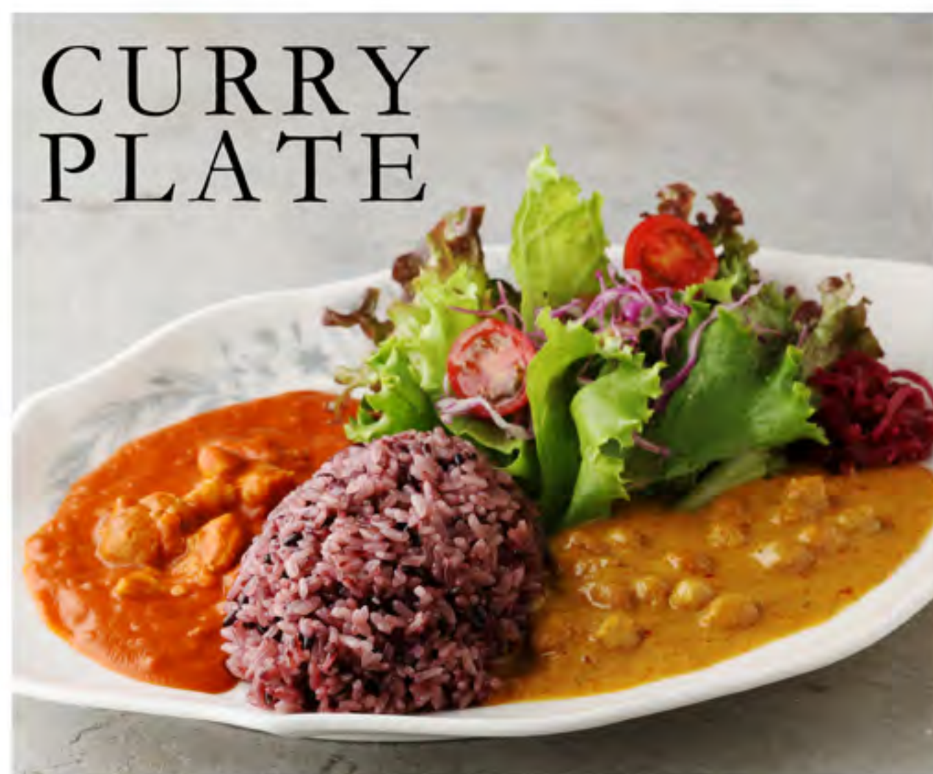
黒米ごはんと2種のカレープレート (バターチキンカレー/ ひよこ豆のイエローカレー)