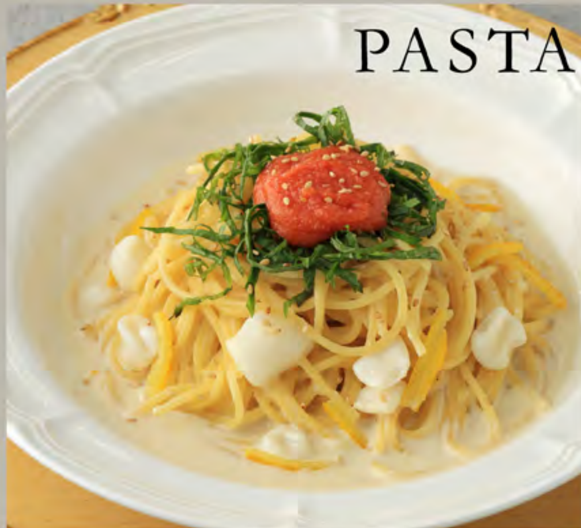
柚子香る ヤリイカと明太子の 豆乳クリームパスタ