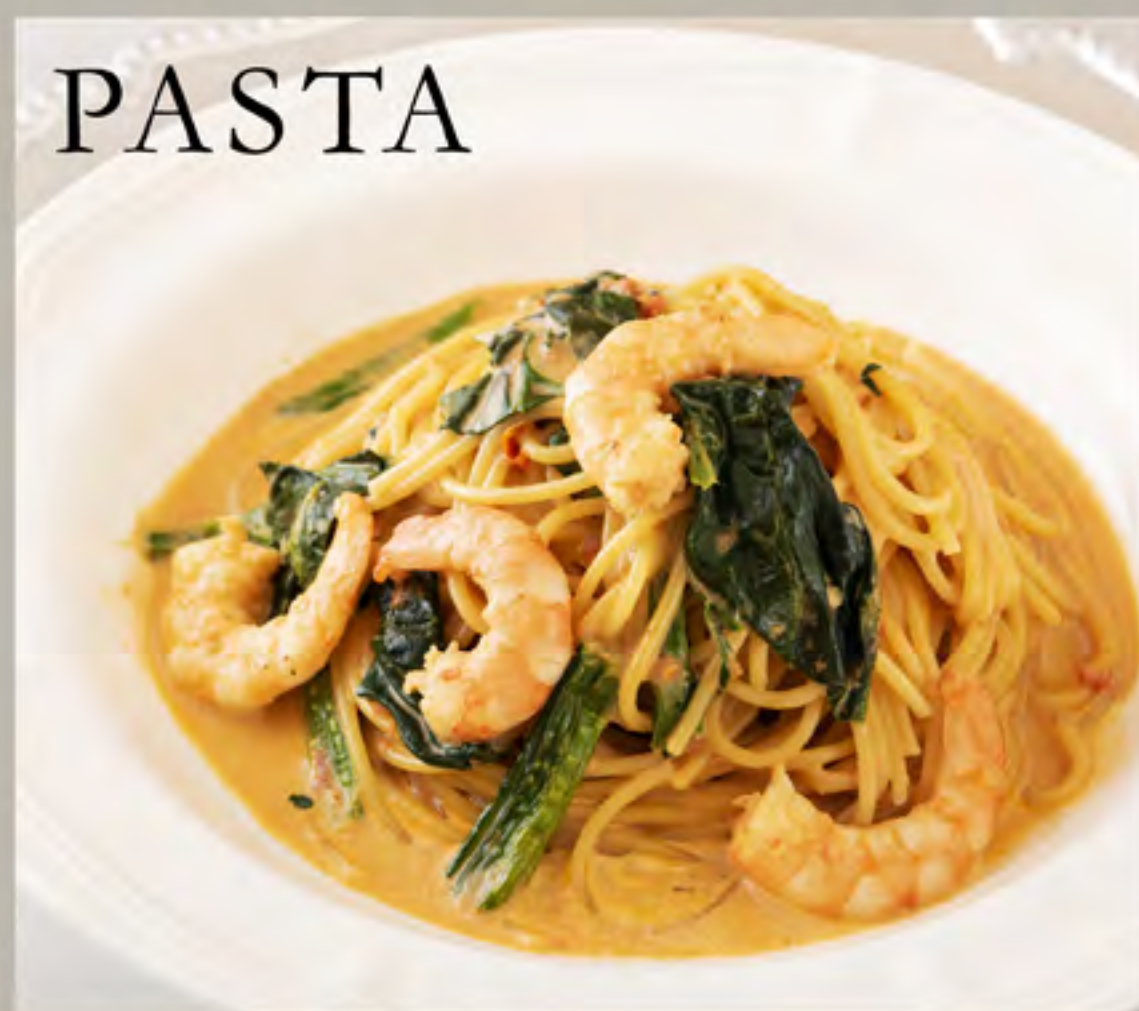
海老とほうれん草の アメリカーナクリームパスタ