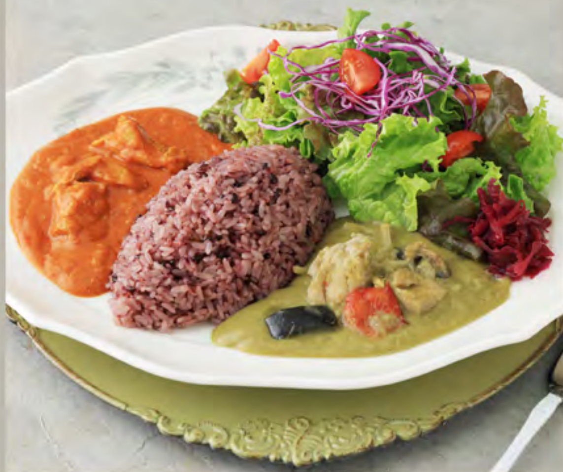
黒米ごはんと2種のカレープレート (バターチキンカレー/グリーンカレー)