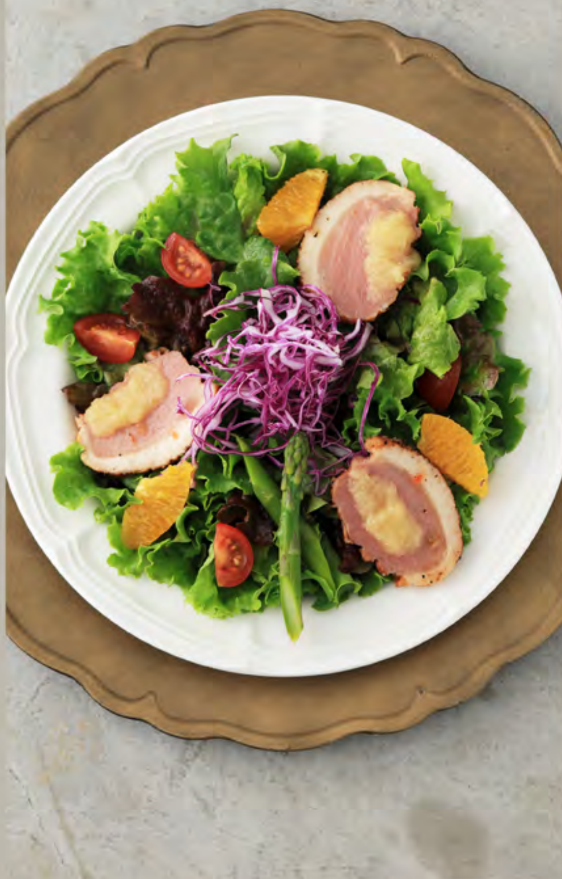
合鴨ローストとオレンジの彩りサラダ