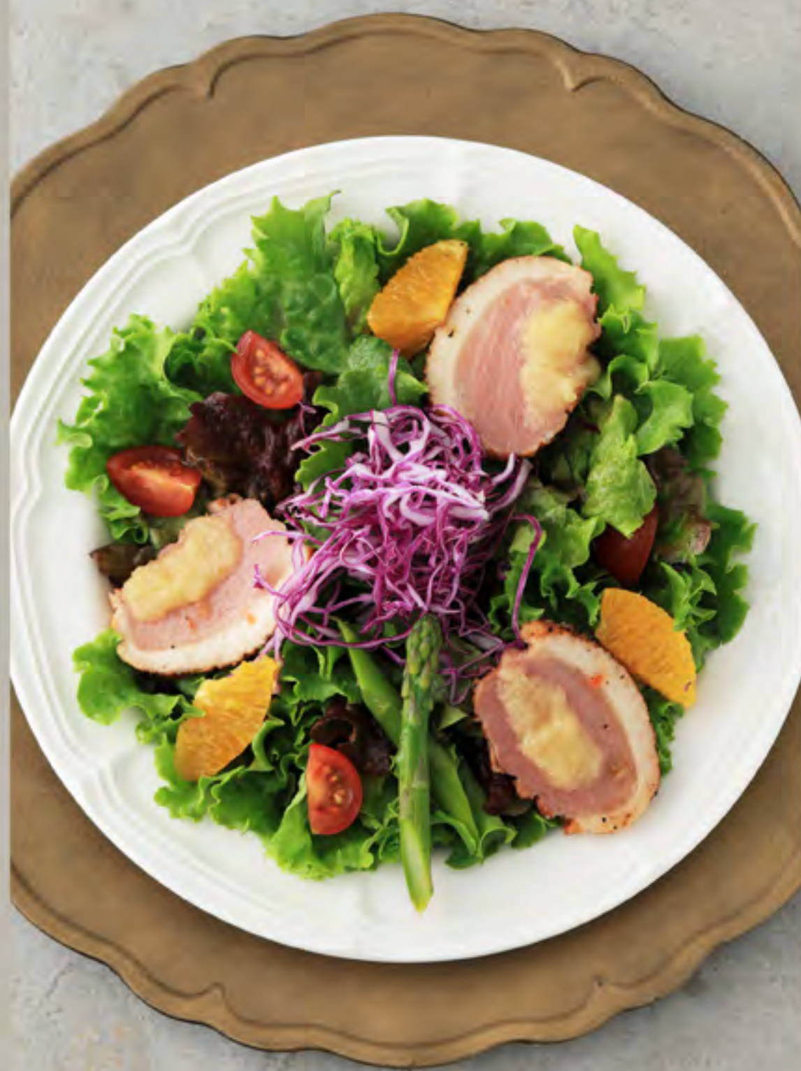
合鴨ローストとオレンジの彩りサラダ