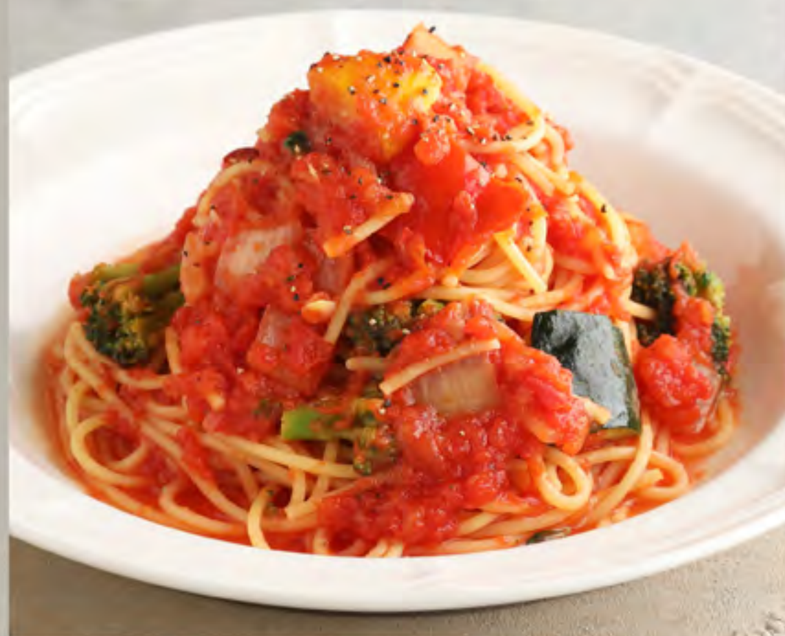
5種野菜のトマトソースパスタ