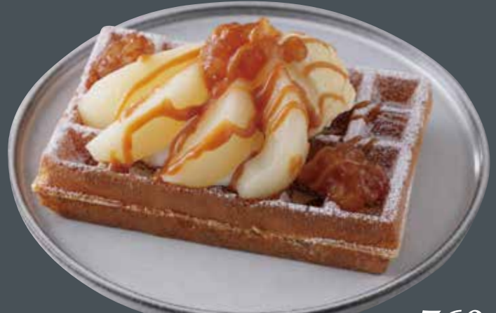
洋ナシとシナモンアップルのワッフル ¥760