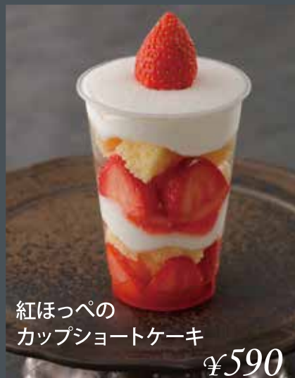
紅ほっぺの カップショートケーキ ¥590