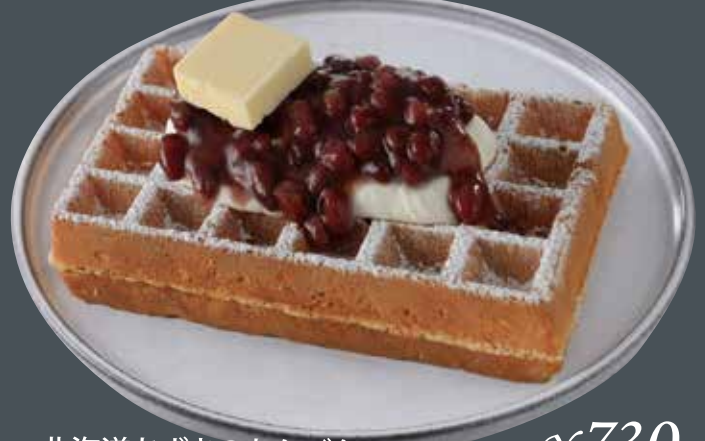
北海道あずきのあんバターワッフル ¥730