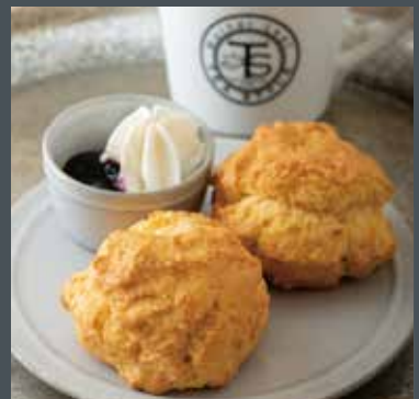
SCONE スコーン (ホイップクリーム&ジャム付) 1個 ¥410 2個 ¥660

※表示価格は税込みです。 ※店内飲食とお持ち帰りは税込み同一価格です。 ※税抜価格は異なります。 ※写真はイメージです。 ※テイクアウト用のフォーク・ナイフが不要のお客様はお申し付け下さい。