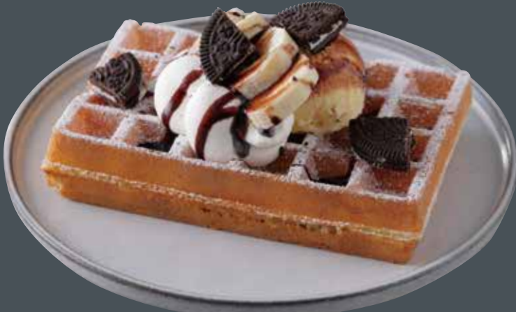
チョコバナナワッフル ¥730